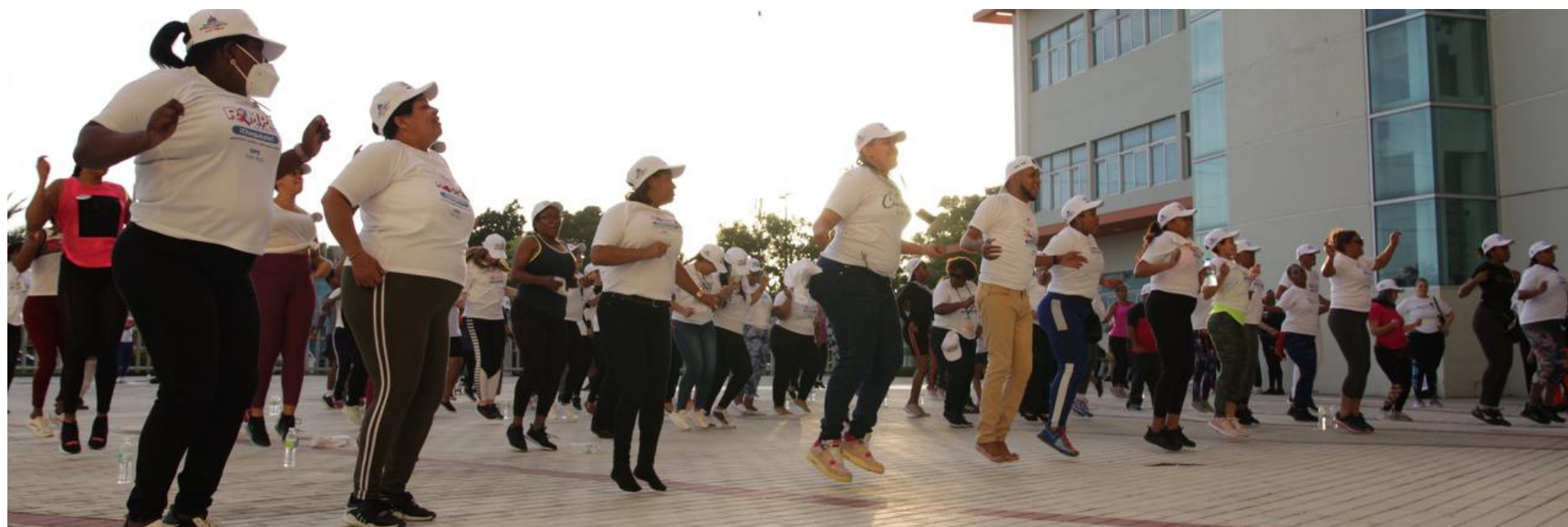
Empleados del Ayuntamiento practican baile de zumba en la explanada del Palacio Municipal.