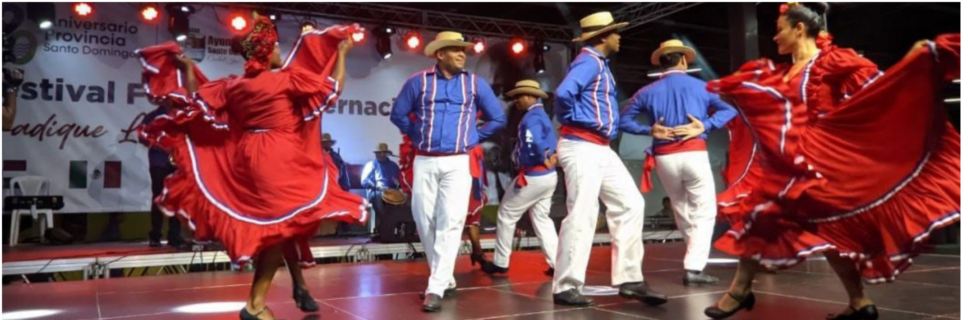
Participación del grupo Guateque, de Puerto Rico, en el Festival Folklórico Internacional Fradique Lizardo.