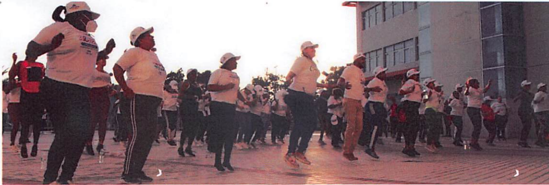
Empleados del Ayuntamiento practican baile de zumba en la explanada del Palacio Municipal.