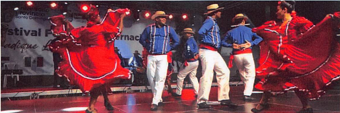
Participación del grupo Guateque, de Puerto Rico, en el Festival Folklórico Internacional Fradique Lizardo.