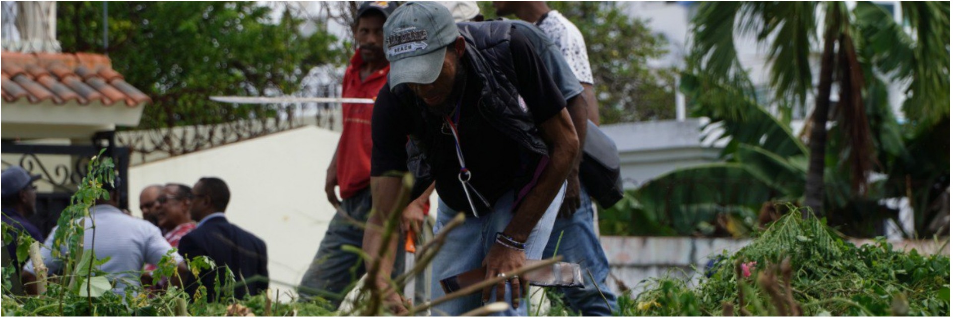
Trabajadores del Ayuntamiento durante los trabajos de intervención de 22 solares baldíos en el municipio de Santo Domingo Este.