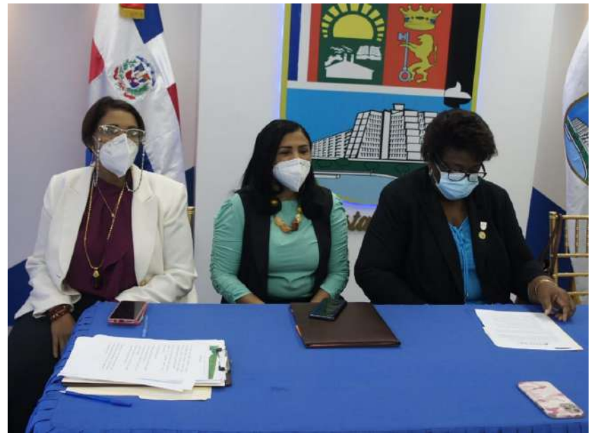
La vicealcaldesa Ángela Henríquez encabeza el taller “Unidades de Igualdad de Género en los gobiernos locales: Rol y Funcionamiento”.

La actividad, que se realizó en el salón de eventos del Palacio Municipal, se desarrolló en coordinación con la Federación Dominicana de Municipios (FEDOMU) y la Asociación de Municipios de la Región Ozama (ASOMUREO).