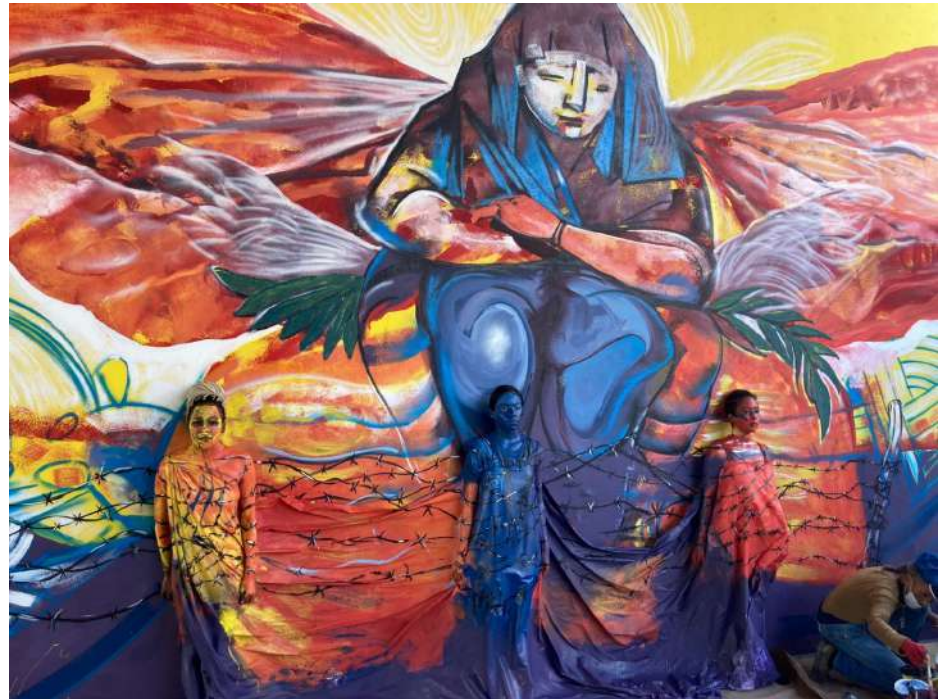
Mural dedicado a la Lucha contra la violencia hacia la mujer.

Al finalizar la caminata en la que participaron estudiantes, dirigentes comunitarios, obreros, colaboradores del Ayuntamiento, motoconchos, empresarios, representantes del Ministerio Público,