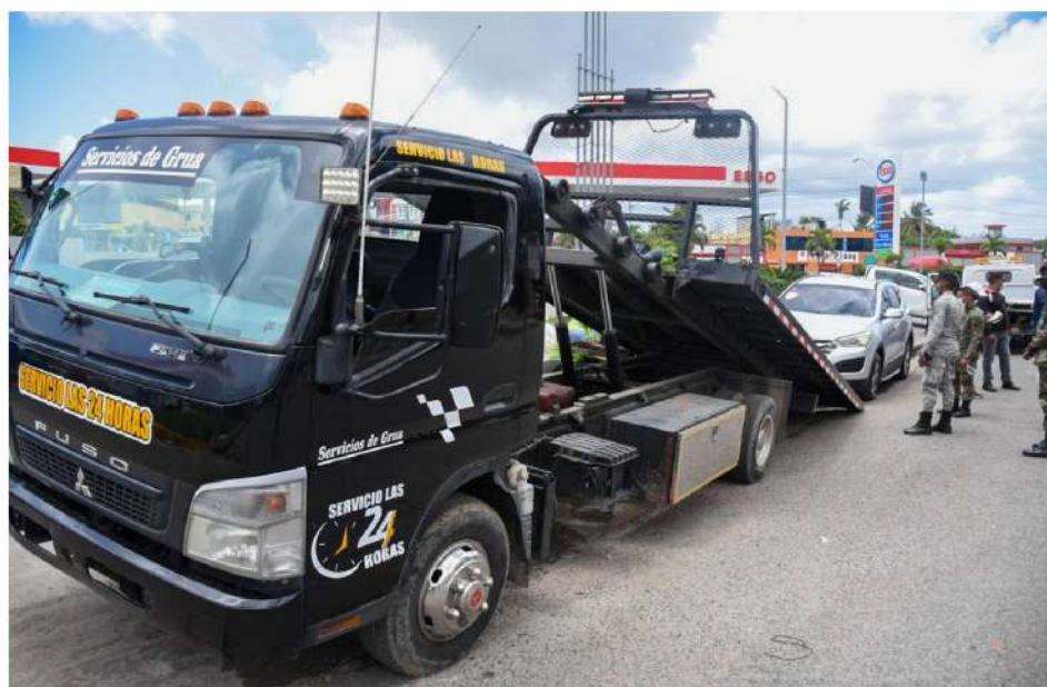
Brigadas de Defensoría de Espacios Públicos del ASDE, cumplen las normativas, retirando vehículos que ocupan las vías.

La operación "Súbelo" pretende devolver a municipales aceras, calles y avenidas ocupadas por dealers