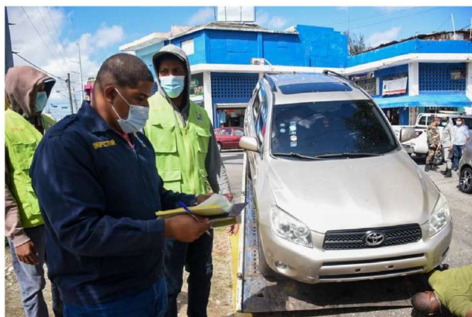
Los infractores de la Ley también deben pagar una multa.

Después de entregarles notificaciones formales y darles un plazo de más de 40 días a los negocios de dealers del municipio, el Ayuntamiento de Santo Domingo Este inició este lunes un operativo de retención de vehículos colocados para fines de venta en aceras, parques, calles y avenidas principales de la ciudad.