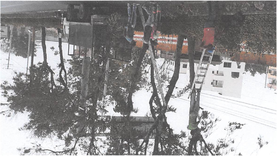
● Poda de árboles y barrido realizado en la Av. Charles