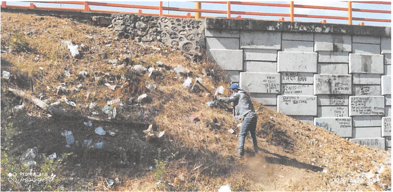
Luego de una larga jordana de nuestras brigadas en el puente Duarte y sus alrededores