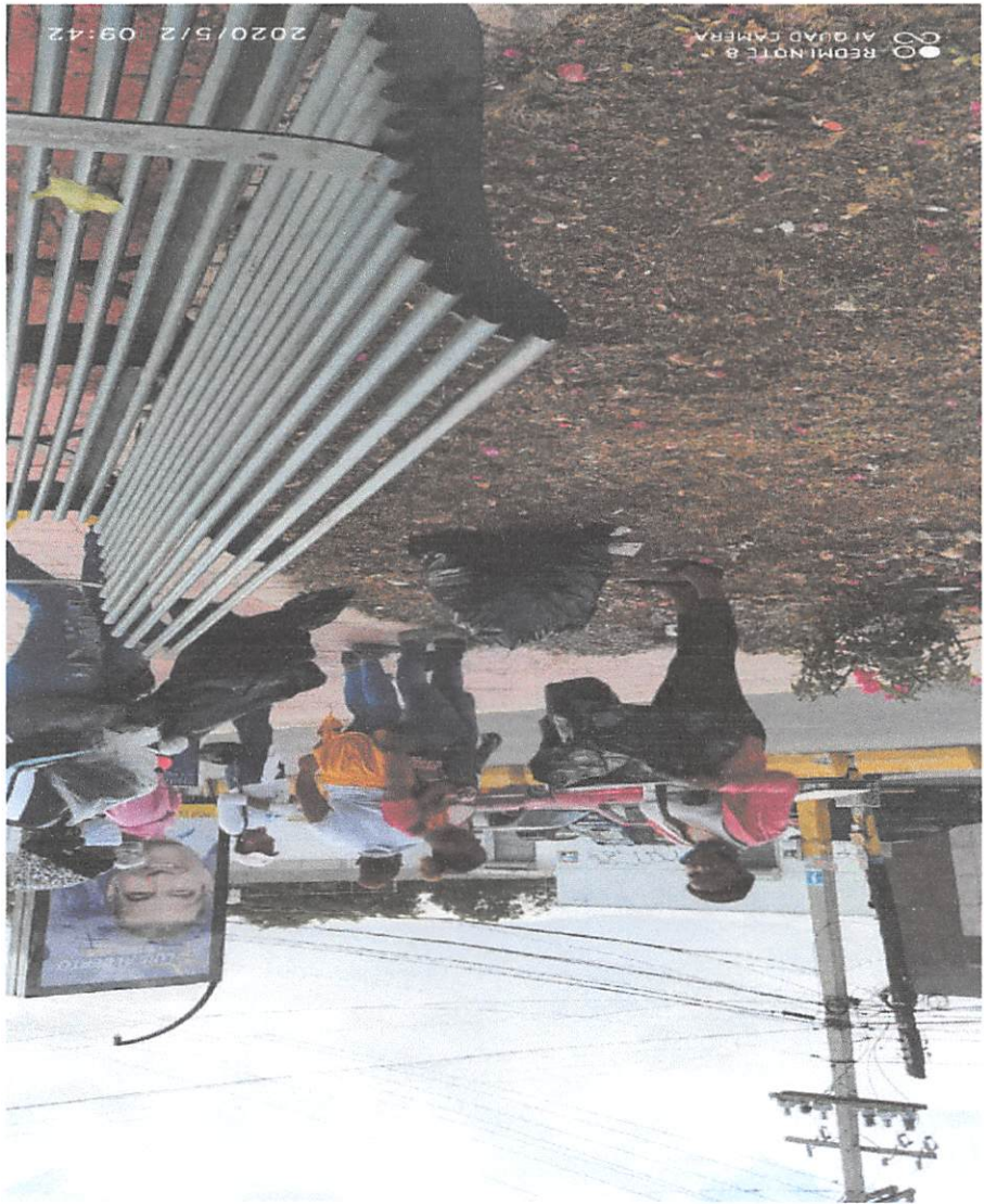
● Limpieza de intersección de la Carretera Mella con Av. Sabana Larga