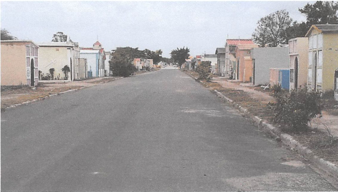
Luego de una jornada de trabajo, así quedaron las calles del cementerio Cristo salvador