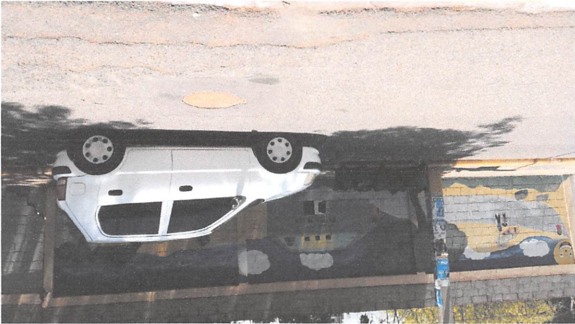
Así quedo los alrededores de la Patria Mella luego de la intervención de nuestras brigadas de limpieza