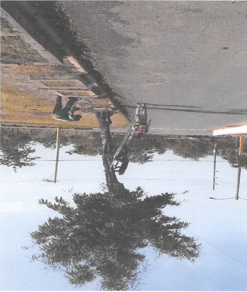
● Mantenimiento de la entrada del cementerio Cristo Salvador