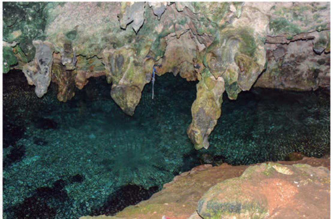
Aguas subterráneas Gran Parque Nacional Ecológico de Las Américas KM 14.