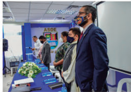
Palabras de Oración.