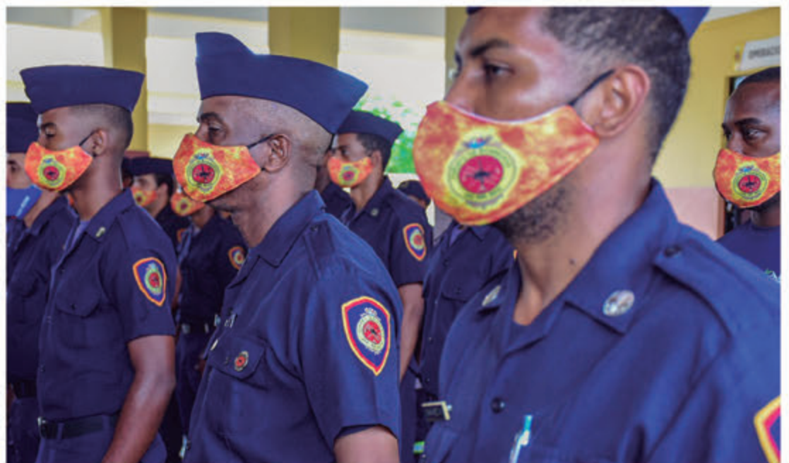
Pelotón de Bomberos en parada de atención.