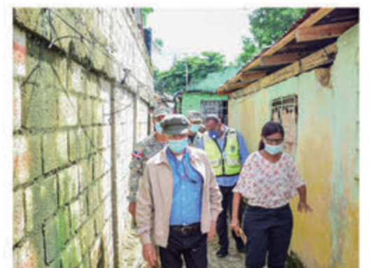
Alcalde SDE mientras visitaba una vivienda la cual será donada a una pareja de esposos de escasos recursos.