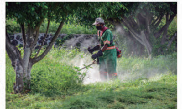
Obrero del ASDE realizando trabajo de poda.