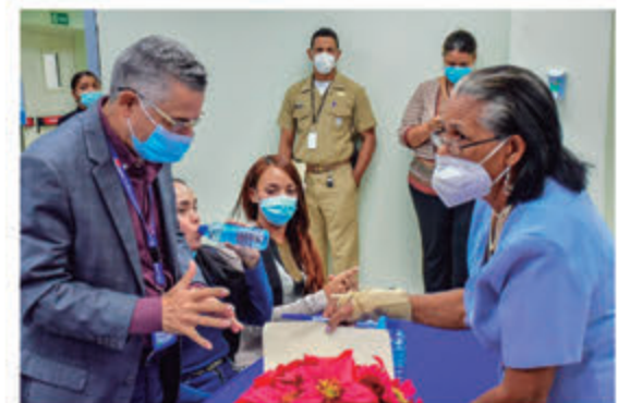
El Alcalde recibe propuesta de comunitarios.