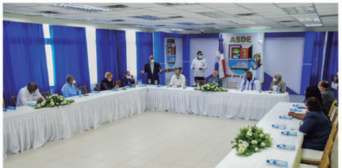
Comité Pro Cámara de Comercio y Producción de la Provincia Santo Domingo.