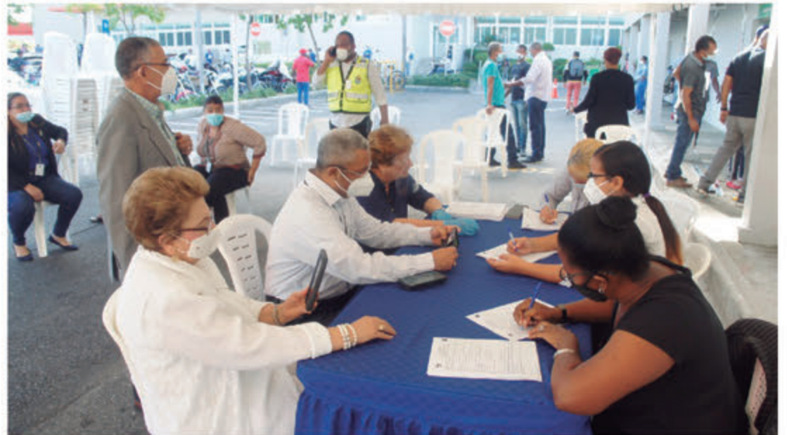
Directores y Asistentes del ASDE se inscriben para tomar pruebas PCR.

La jornada de pruebas PCR también se estarían llevando a destacamentos policiales, beneficiándose cada miembro de la institución, como también los privados de libertad. Las pruebas PCR en las instalaciones del ASDE se estarán llevando a cabo a partir de este jueves 5 de noviembre a directores, empleados y colaboradores.