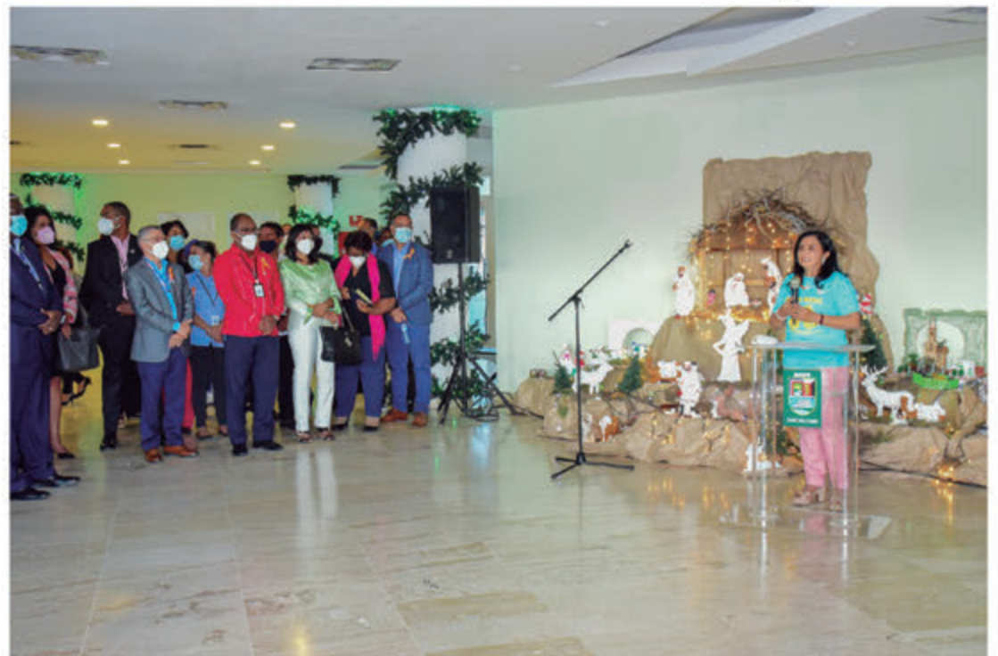
Ángela Henríquez vicealcaldesa durante acto por la “No violencia contra la mujer”.