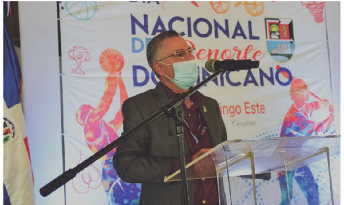
Alcalde se dirige a los atletas presentes en la celebración del Día Nacional del Deporte.

En la ceremonia el alcalde resaltó el aporte de los atletas del municipio, presentes en la actividad, por sus esfuerzos para representar a SDE en diferentes disciplinas deportivas.