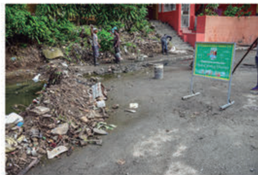
Obreros sacando escombros en Villa Duarte.