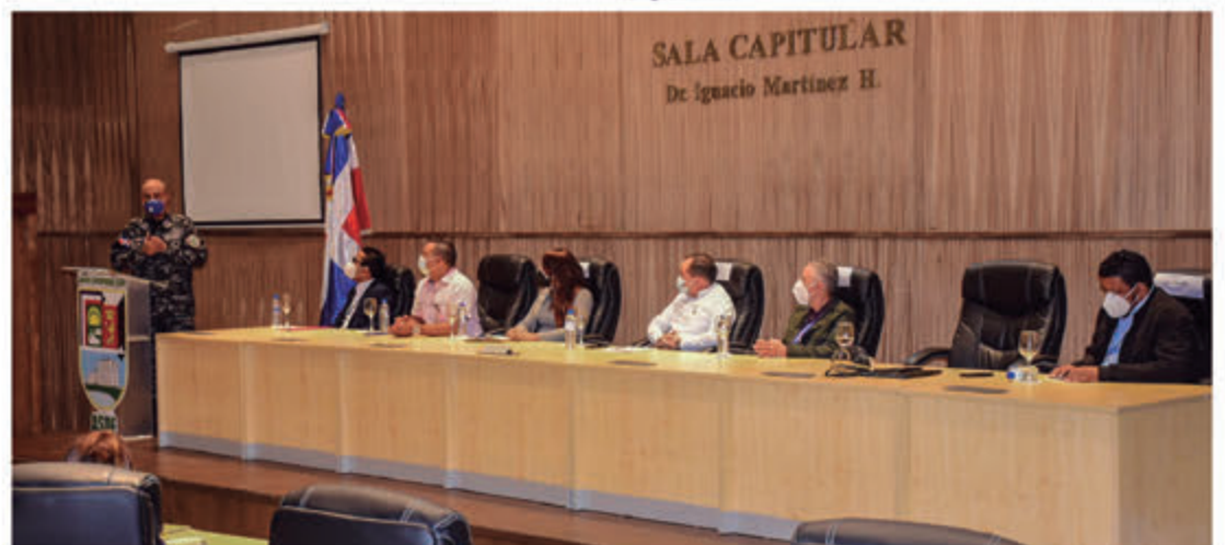
General Máximo Báez Aybar presenta plan de trabajo en la Sala Capitular del ASDE.