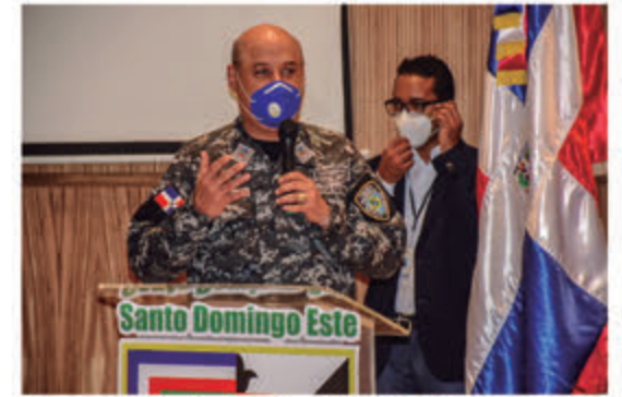
General de brigada PN Máximo Báez Aybar.