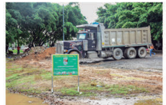
Camión volteo donde son trasladados los escombros.