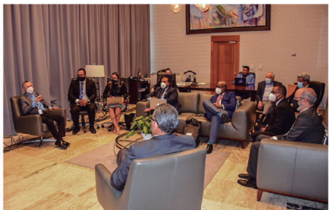
Presentación de propuesta de lo que será el Plan “Ciudad Inteligente”.