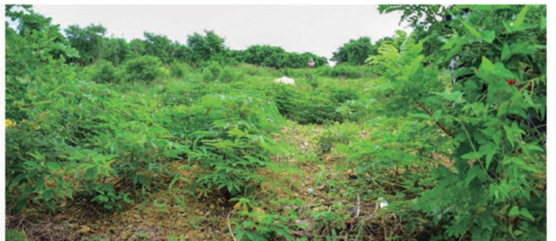
Terrenos propiedad del estado en el Km 14 de la aut. Las Américas.