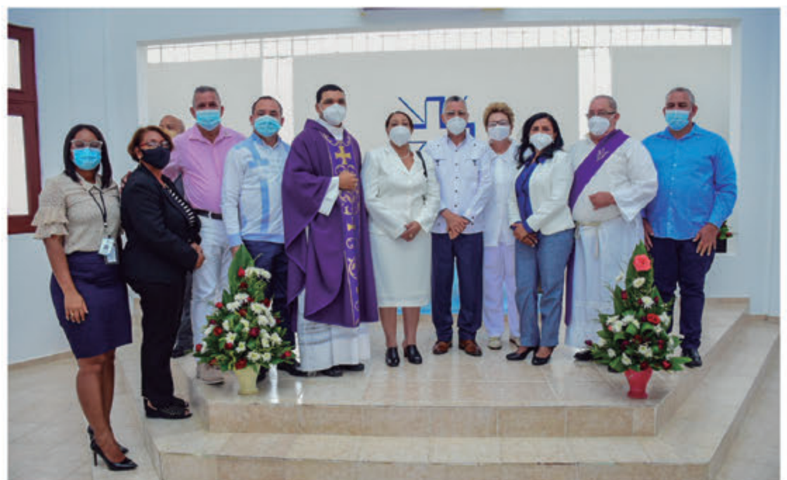
Autoridades Municipales y eclesiásticas SDE posan al final de la misa.