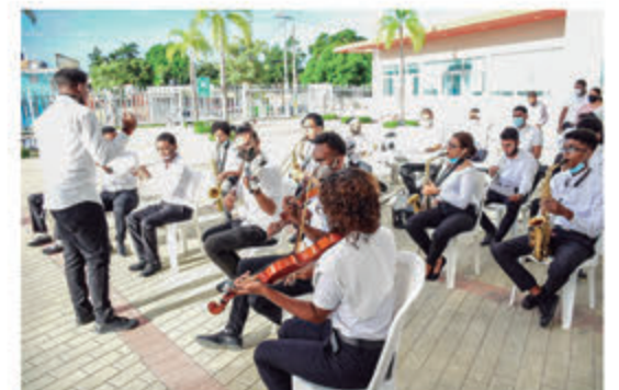
Banda Infanto Juvenil del ASDE.