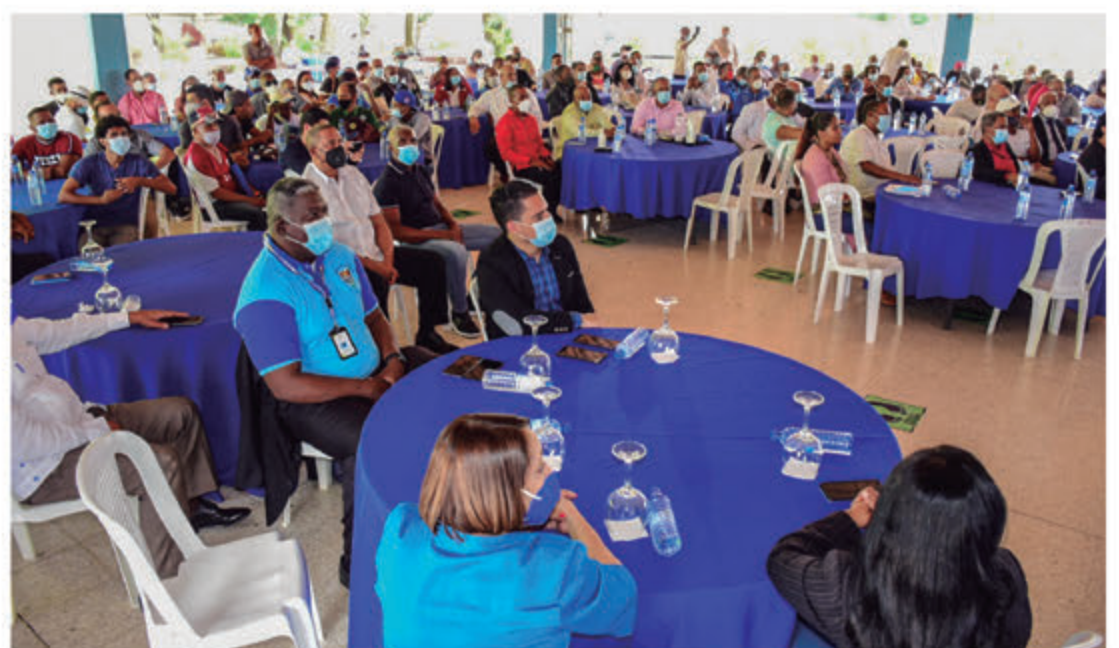
Público Presente y Atletas en la actividad conmemorativa al Día Nacional del Deporte.