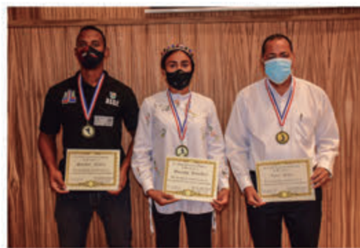
Atletas reciben certificado y medallas a la excelencia deportiva.