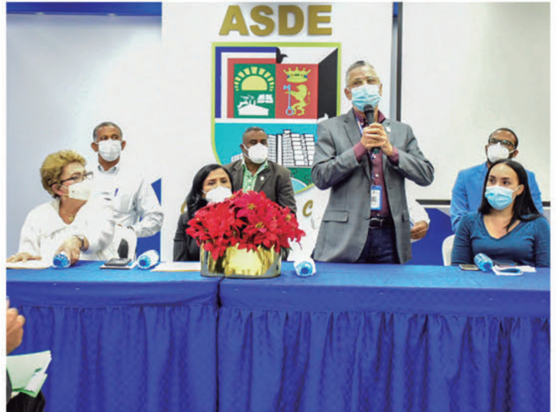
Alcalde Manuel Jiménez y Mesa Directiva.

Esta semana acudieron a la sede municipal 45 representantes de bloques de las circ. I, II, III; IV, V, VI, VII, VIII Y IX, del número 3 de la demarcación. Entre los sectores se encuentran: El Almirante, Invivienda, Monserrat, Villa Liberación, La Toronja -Caña, Los Solares, Kilombo, El Tamarindo, Mendoza, Villa Carmen, entre otros sectores aledaños a la avenida Charles de Gaulle. Por el Cabildo acompañaron al alcalde, funcionarios municipales y varios regidores de la sala capitular del ASDE.