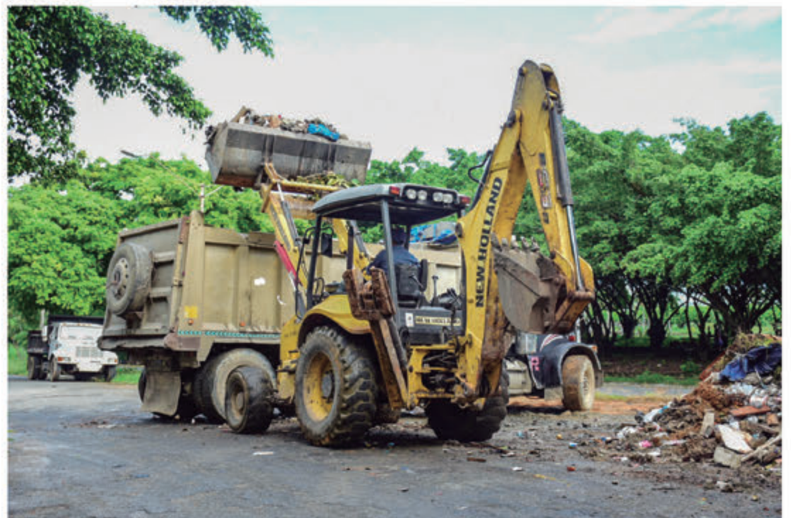
Equipos pesados del ASDE retiran escombros y desechos de áreas verdes.