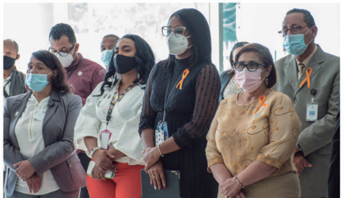
Parte de las colaboradoras del ASDE.