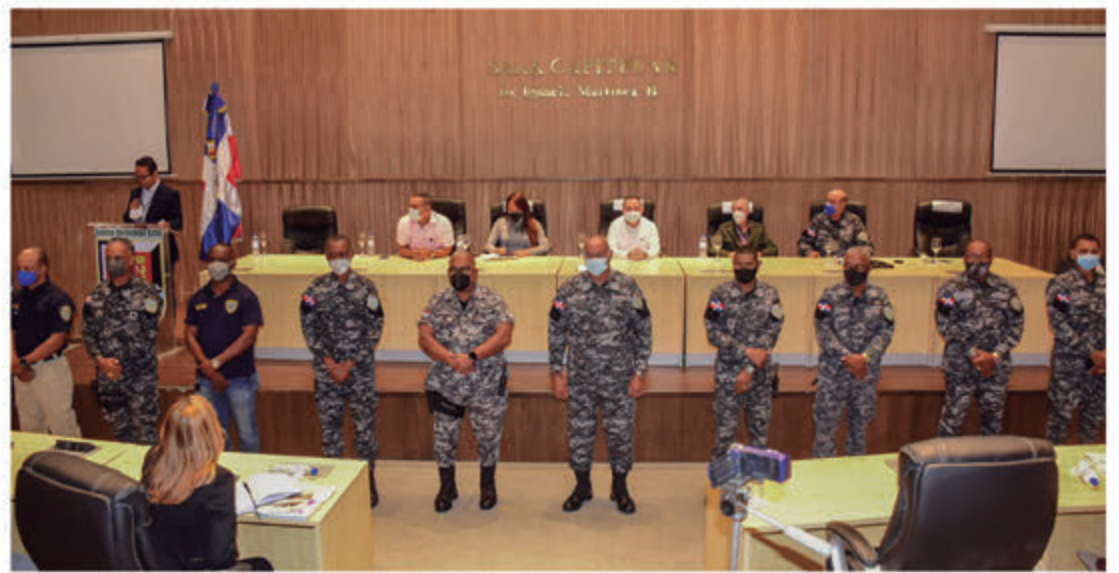
Oficiales Superiores que representan los diferentes destacamentos a nivel regional.