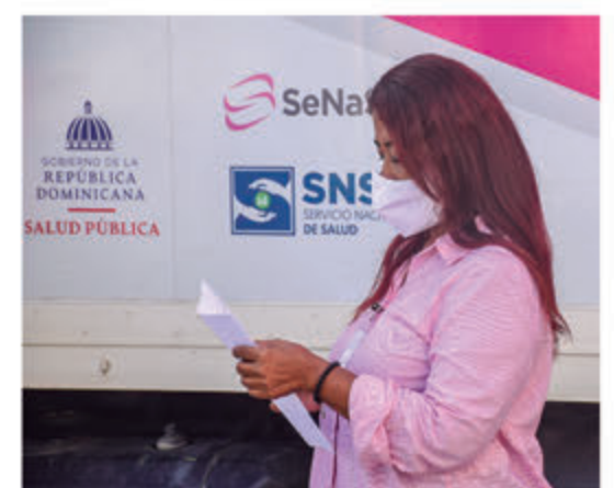
Empleados del ASDE durante el operativo prevención Cáncer de Mama.