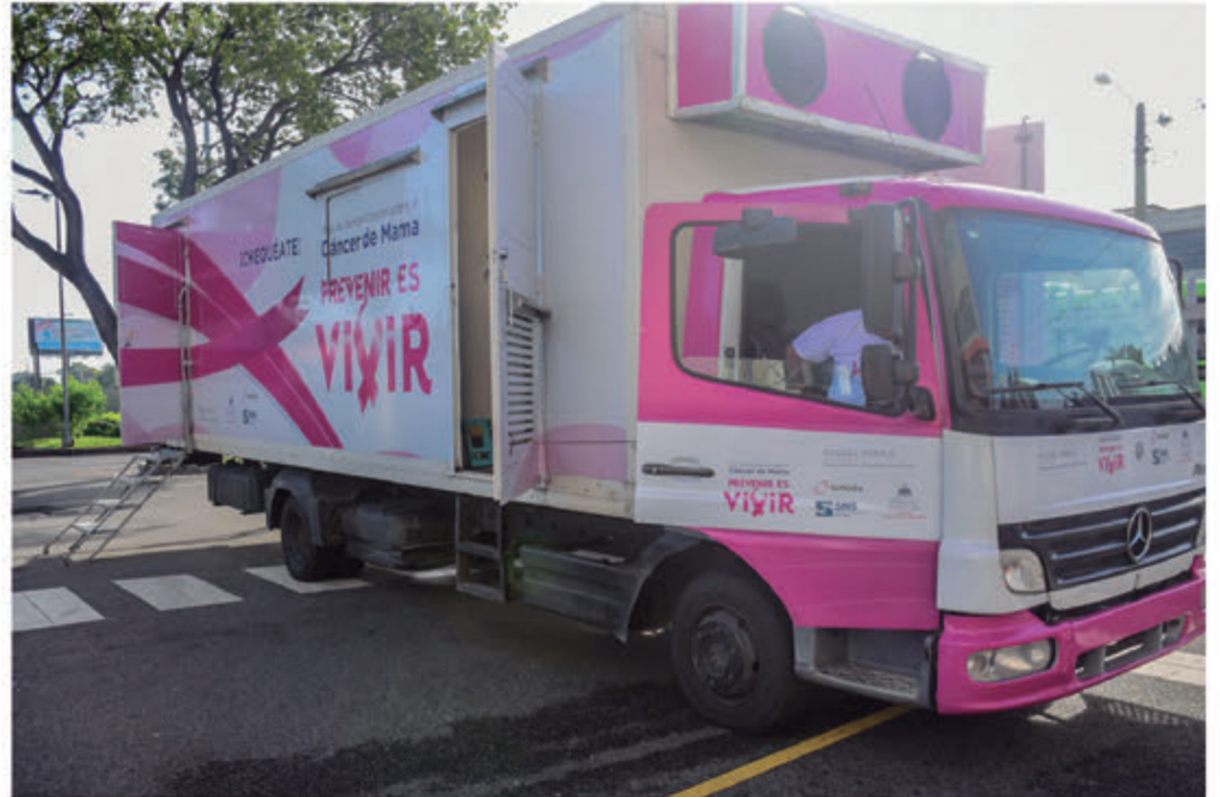
Vehículo Operativo del Programa Prevenir es Vivir.

Explicó Figueroa Espaillat que hasta el momento solo poseen una sola unidad de mamografía, que en la próxima semana obtendrán una segunda unidad y en diciembre vendría la tercera.