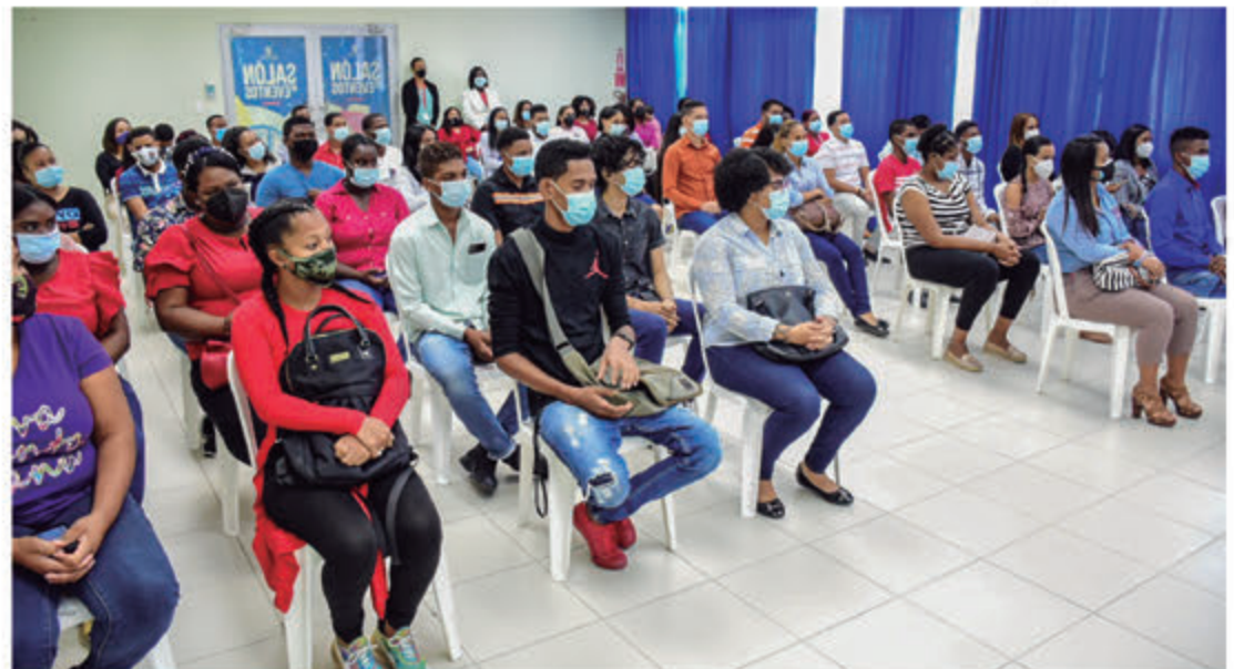
Jóvenes que recibieron becas para integrarse al mercado laboral.