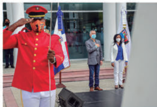
Miembro del cuerpo de bombero izando la Bandera Nacional.