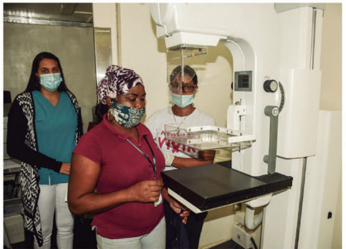
Empleada del ASDE relizandose chequeo de Mamografía.