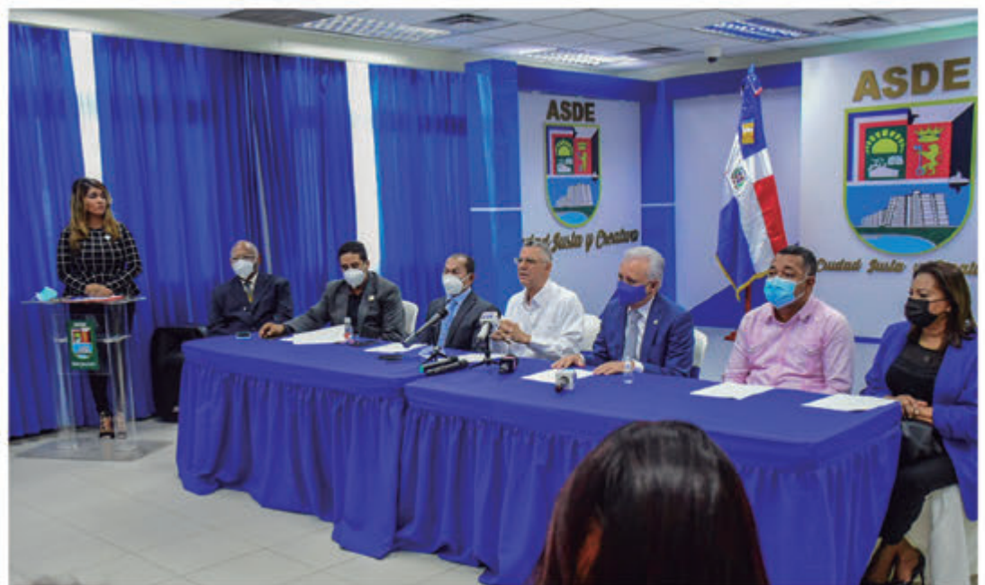
Alcalde de SDE Manuel Jiménez, empresarios, Senador SD, Gobernadora de la provincia y representantes alcaldes de la Mancomunidad.