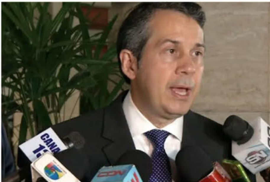
Orlando Jorge Mera, Ministro de Medio Ambiente.