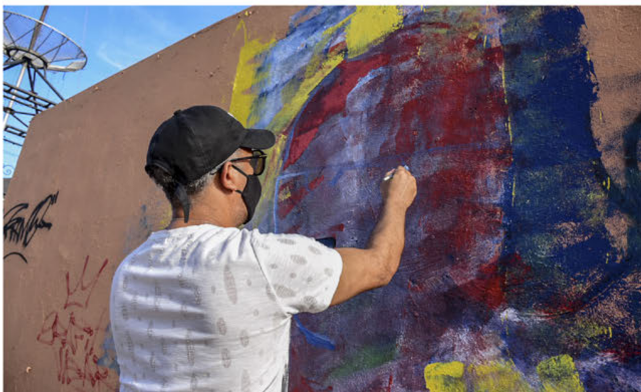
Artista plastico embelleciendo kiosco de Boulevard las Américas.