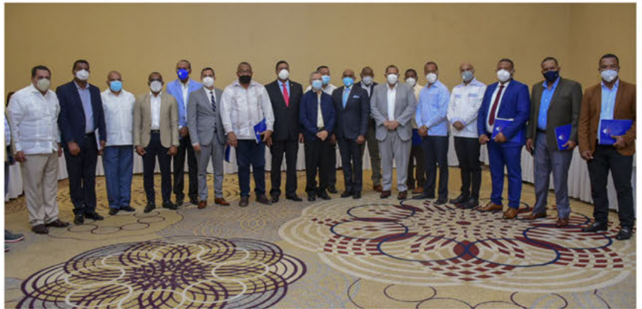
Encuentro de alcaldes durante comisión.