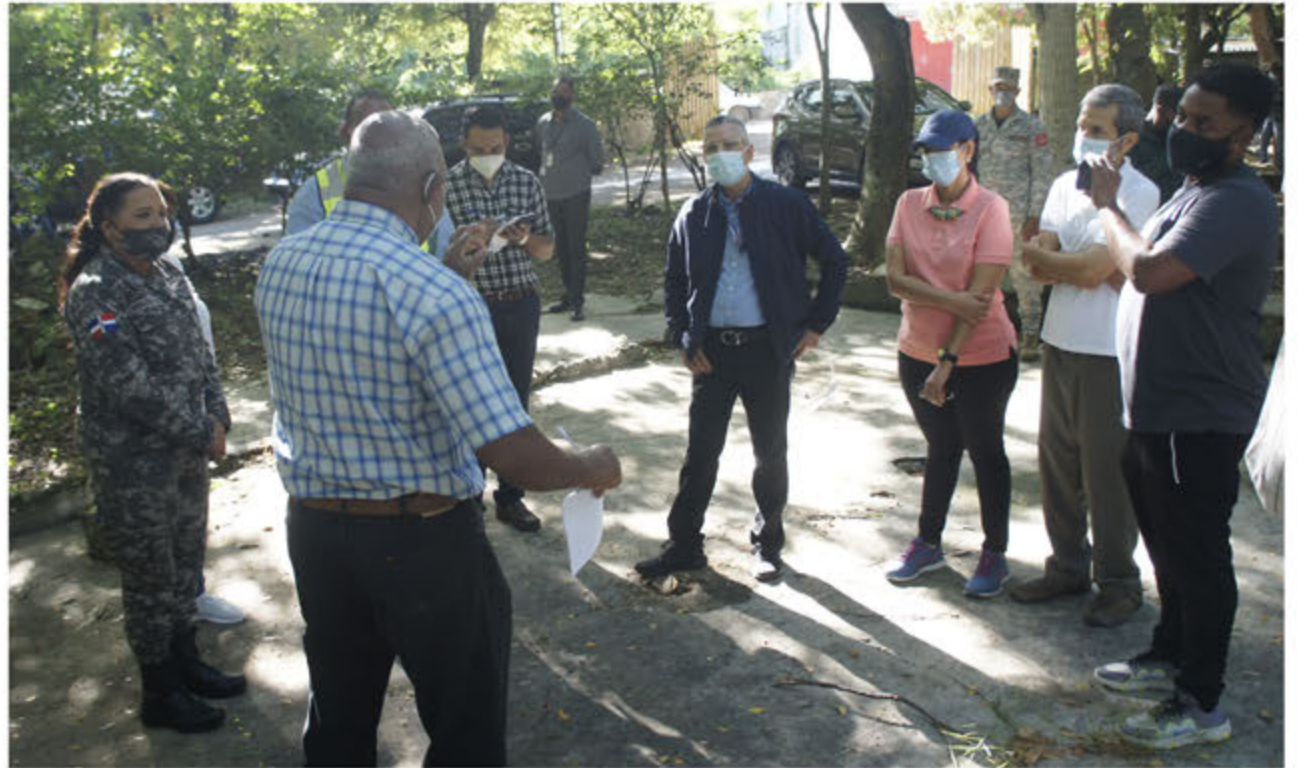
Alcalde Manuel Jiménez junto a especialistas ecologistas en el Cachón de la Rubia.

El Parque del Cachón de La Rubia está ubicado en la rívera del río Ozama en el municipio de SDE. Fue creado mediante el decreto 207-02 del 20 de marzo del año 2002.