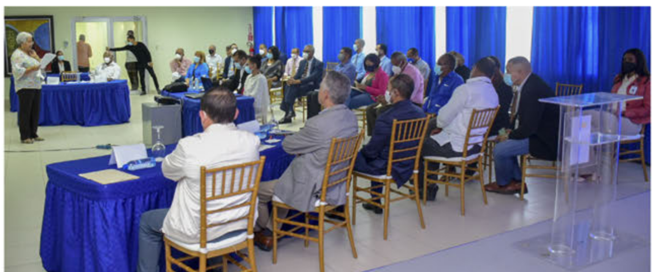
Miembros del consejo de Desarrollo Municipal del ASDE.