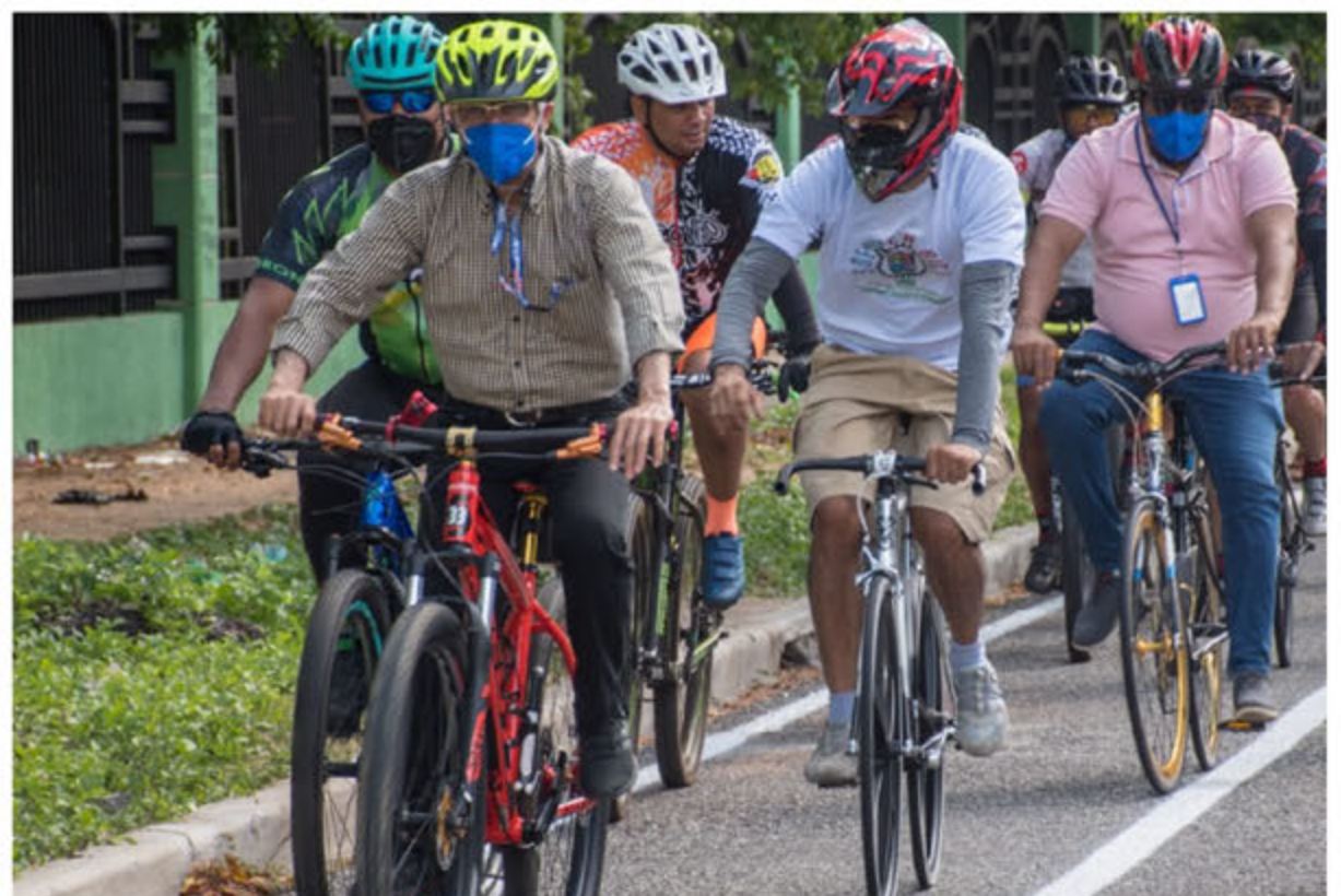
Alcalde Manuel Jiménez, en recorrido durante la inauguración de la ciclovía del municipio SDE.