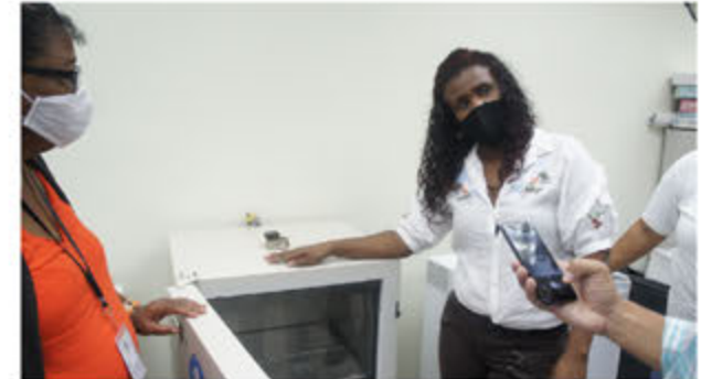
Bióloga del ASDE muestra uno de los equipos del laboratorio.