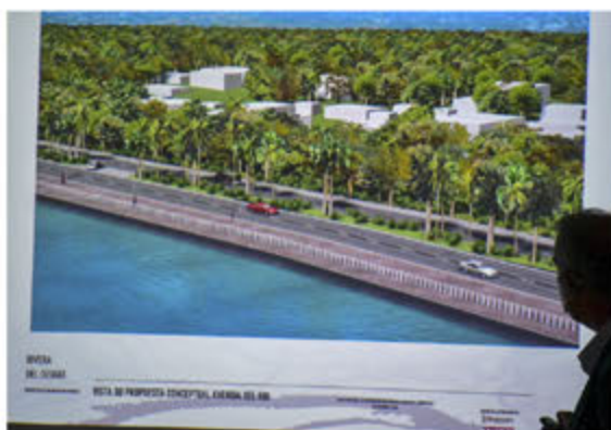
Vista 3d propuesta conceptual avenida del Rio Ozama.