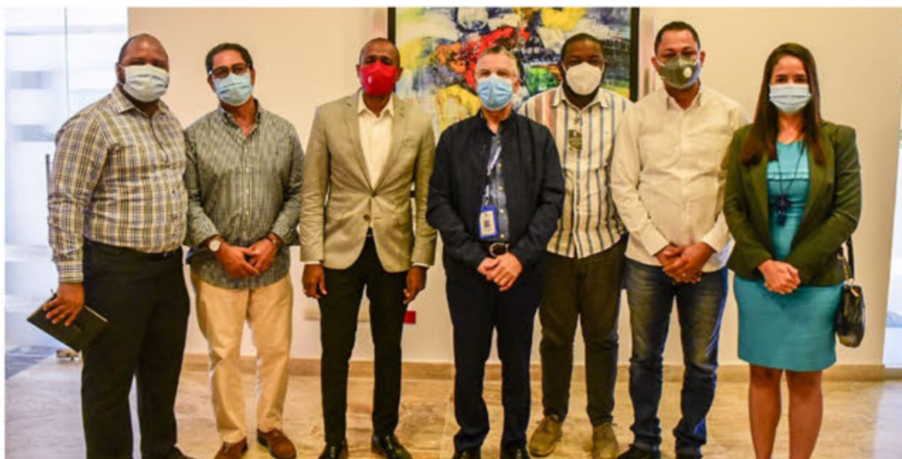
Alcalde Manuel Jiménez junto a la comisión presidencial de desarrollo municipal en SDE.