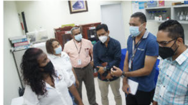
Miembros de la comisión del ADN recibiendo instrucciones de funcionarios del ASDE.