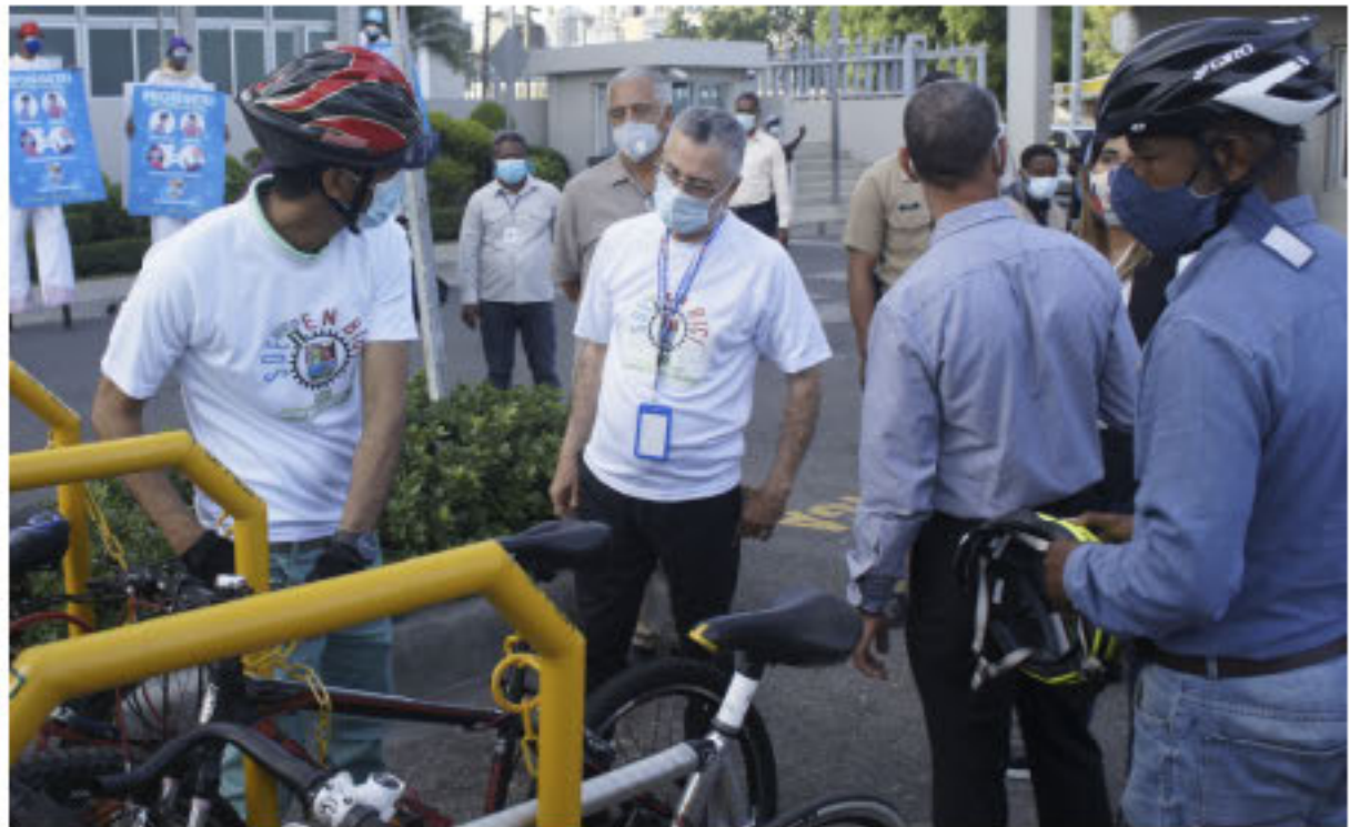
Parqueo de la ciclovía del ASDE.

El ejecutivo municipal exhortó a los conductores a respetarse mutuamente siguiendo el uso correcto de las vías y señales de tránsito, ya que tendrán que acostumbrarse a ver cada día la circulación de bicicletas por el municipio. Con esta iniciativa el municipio de SDE se coloca a la altura de países desarrollados que usan la bicicleta como medio de transporte, como Italia, Japón, China, Alemania, Colombia, Francia, entre otros.