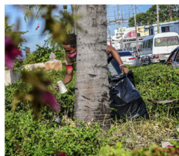
Obreros del ASDE en limpieza de la Autopiasta las Américas.