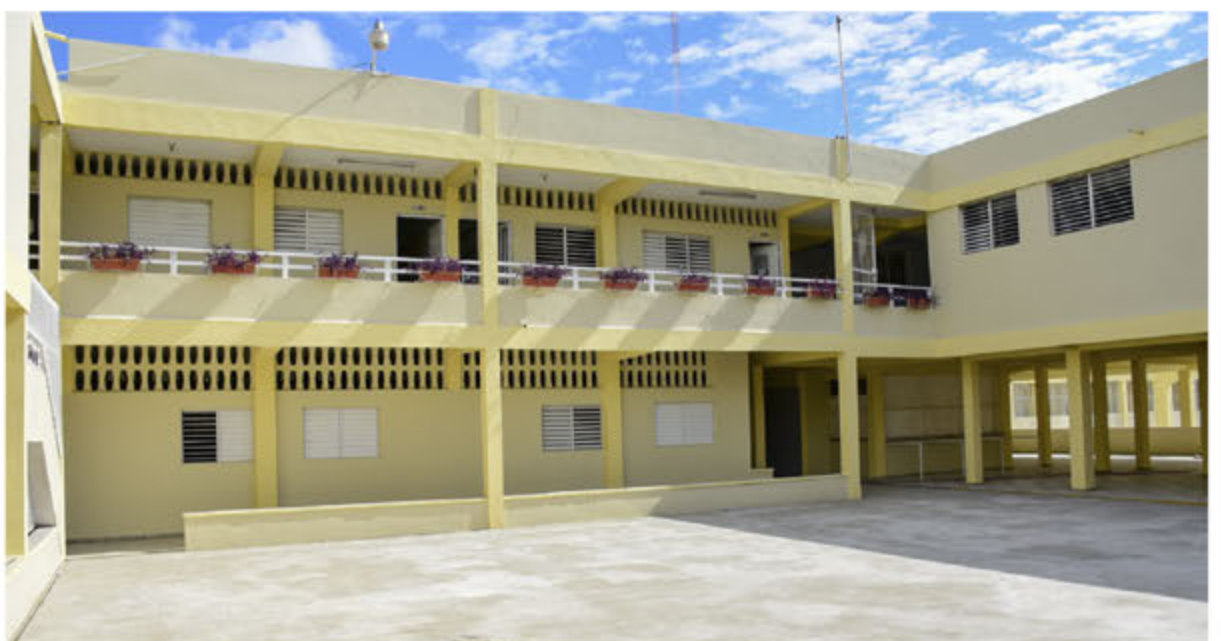
Vista frontal del edificio donde se funcionará próxima UASD en SDE.