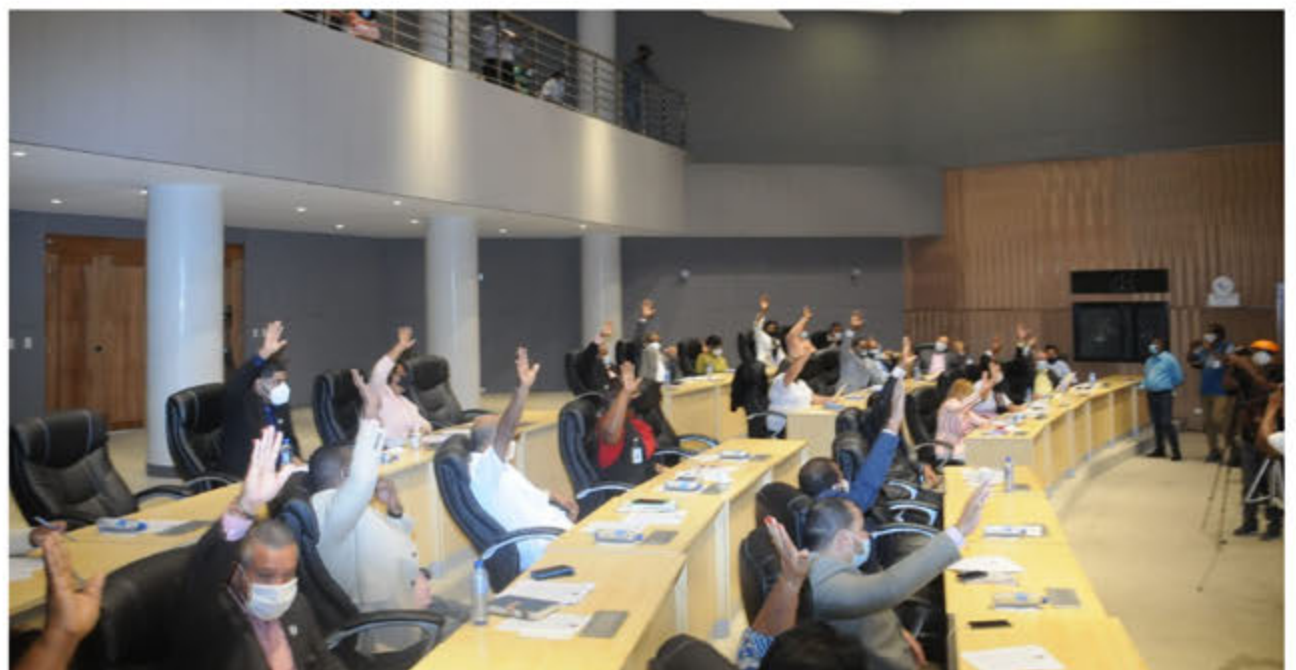
Regidores en la juramentación de nuevos funcionarios del ASDE.