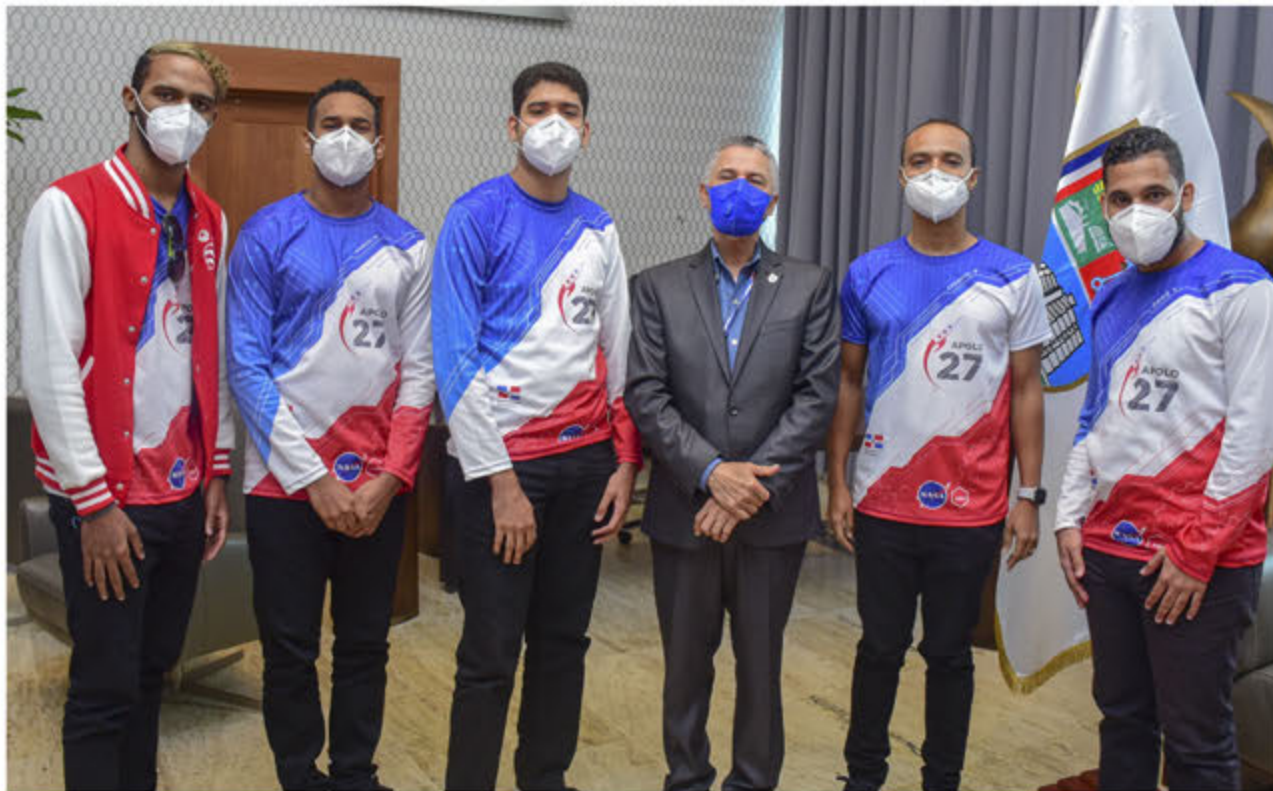
Alcalde Manuel Jiménez posa junto a los estudiantes de INTEC, ganadores del concurso de la NASA.

El equipo representó al país y a la universidad INTEC en esta competencia que reúne a participantes de Estados Unidos y otras partes del mundo.