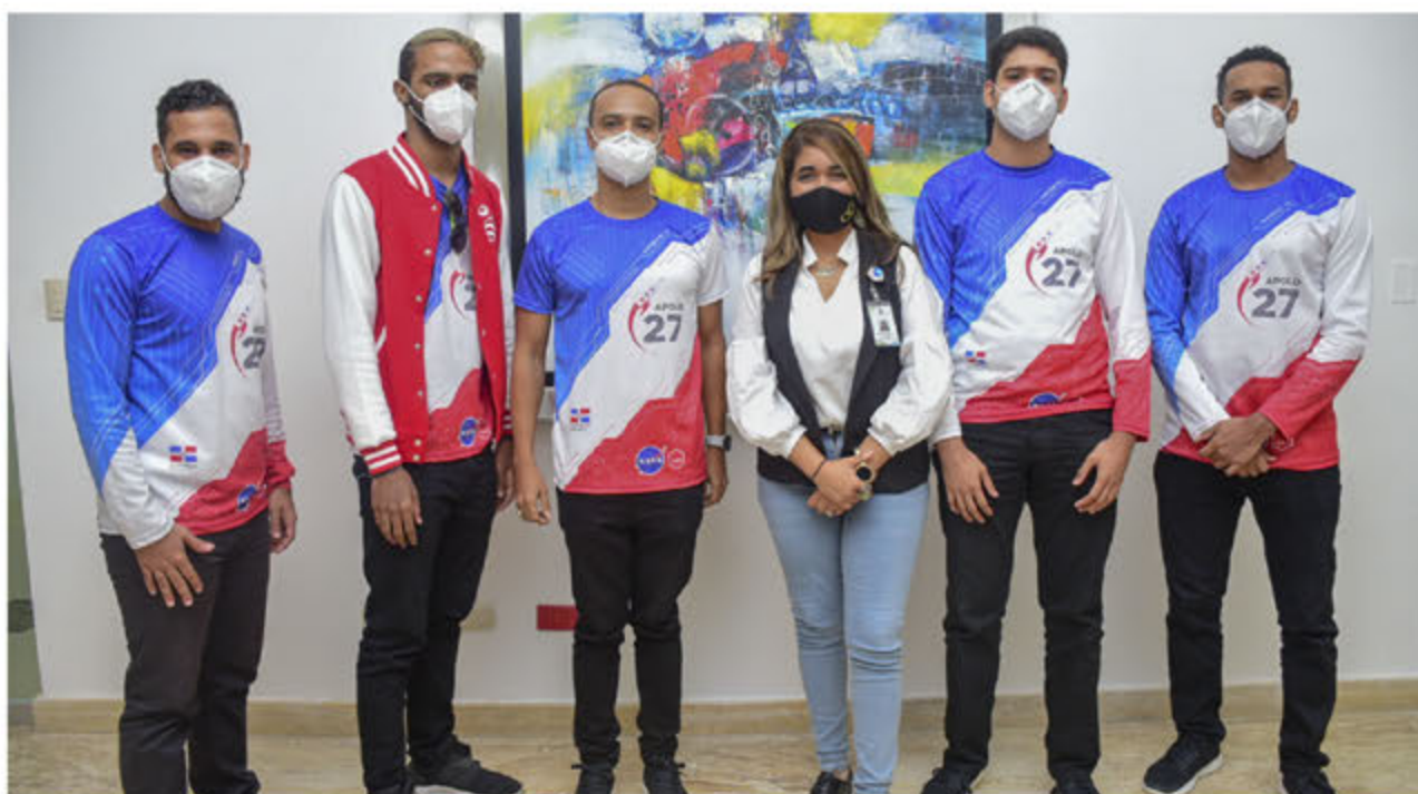
Jóvenes también visitaron el departamento de comunicaciones del ASDE.