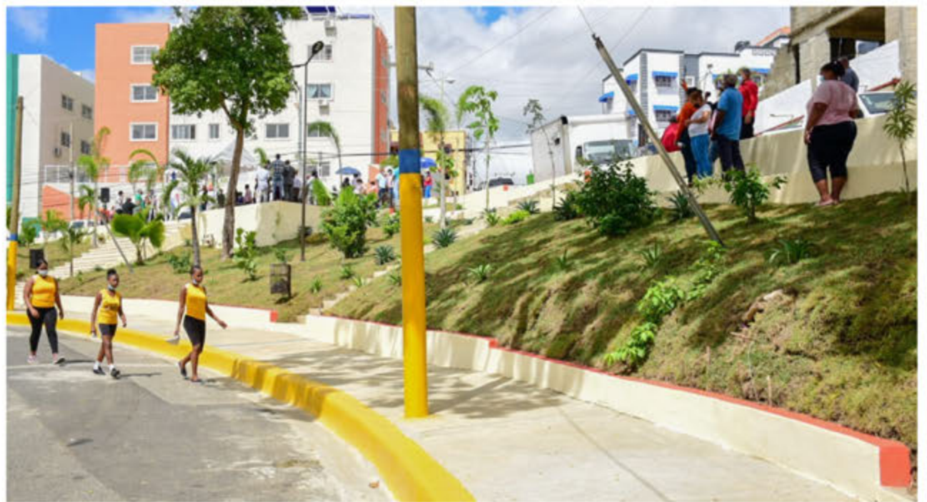
Panorámica del parque Amapola.