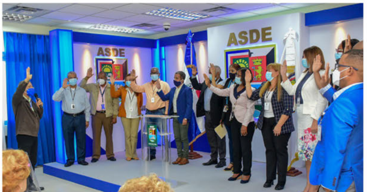
Juramentación de Miembros del Comité de Calidad del ASDE.