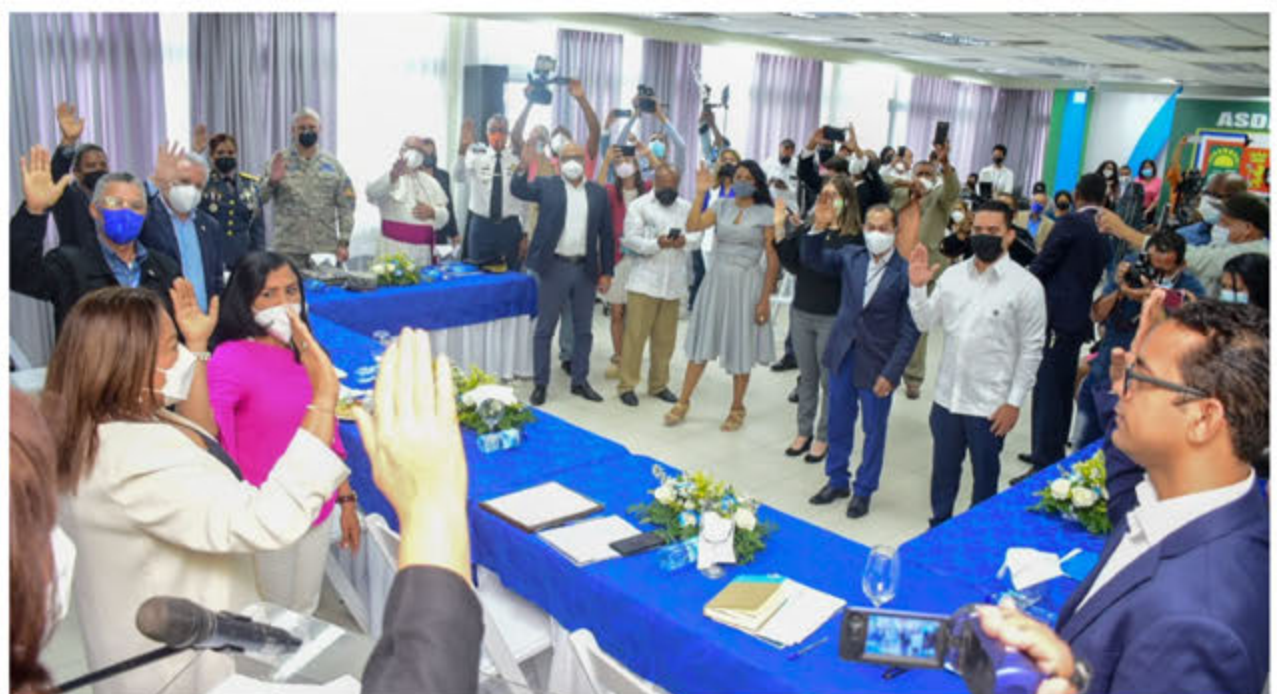
Juramentación de la mesa local de seguridad, ciudadanía y género en Santo Domingo Este.