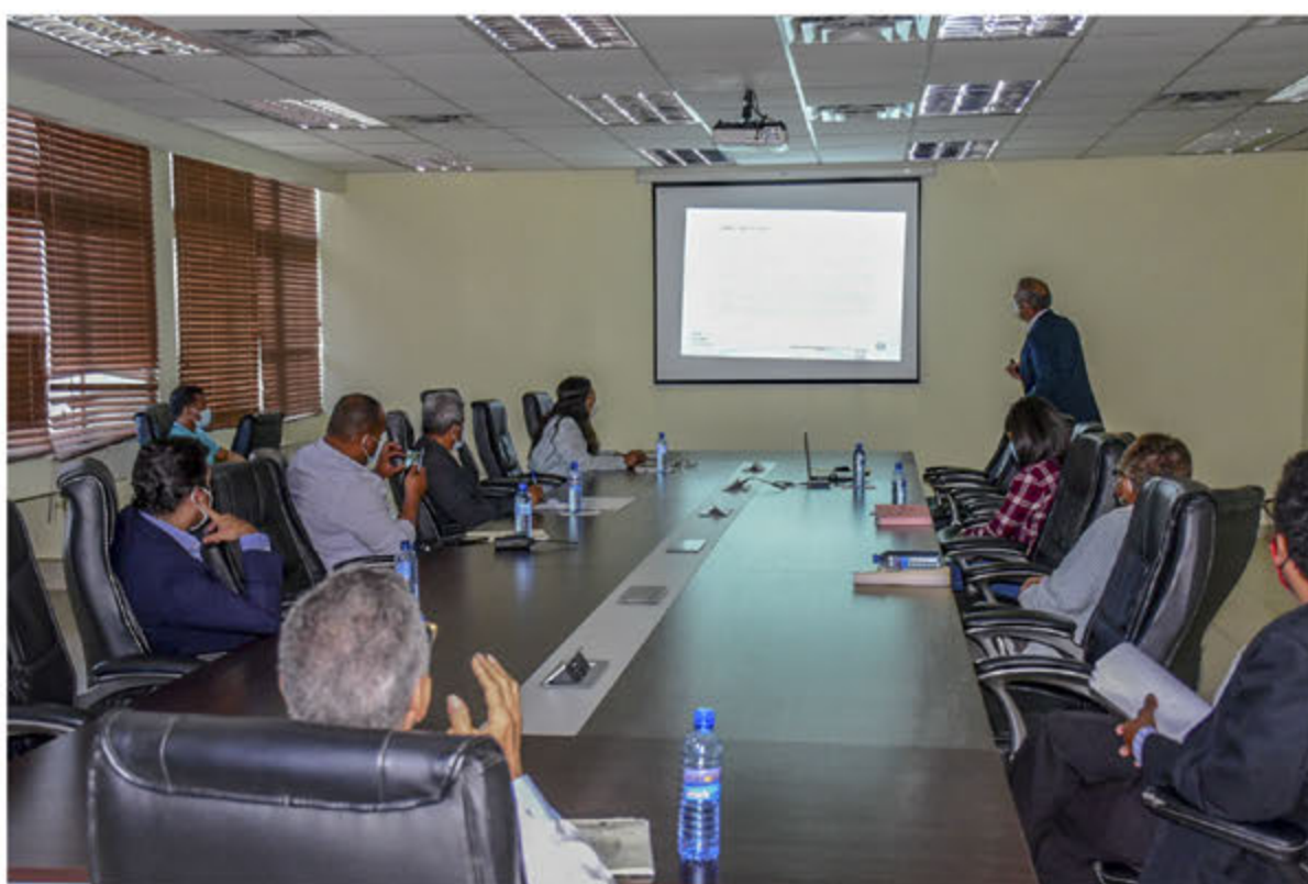
Exposición de la propuesta ribera del Ozama.