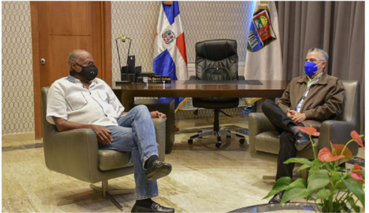
El merengero jhonny Ventura mientras conversa con el alcalde Manuel Jiménez.

Jhonny Ventura, quién es también conocido con el mote de El Caballo, se expresó en esos términos en el marco de un encuentro con el alcalde Jiménez llevado a cabo en despacho de éste, y que también contó con la presencia de sus hijos, Juan José y Jandy Ventura, quienes también son merengeros.