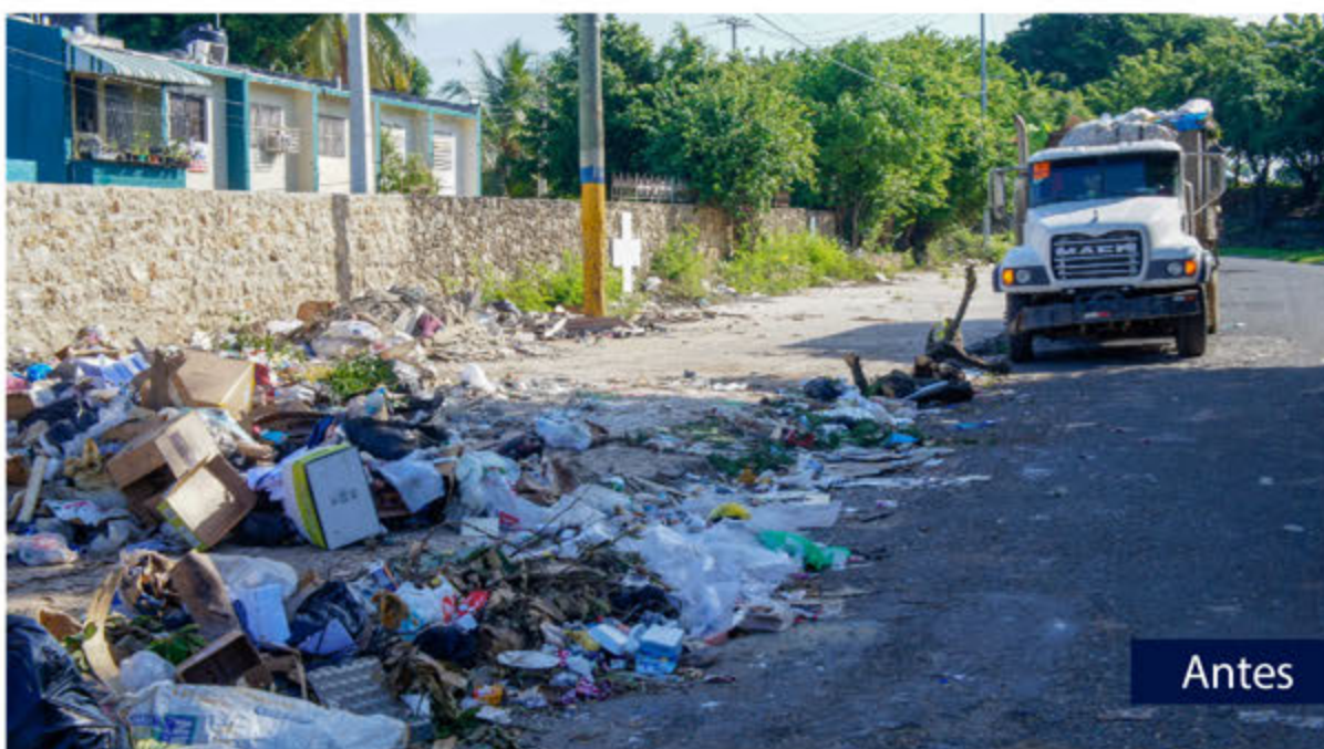
Actual lugar donde estaba el vertedero de la Gloriosa, Villa Duarte.