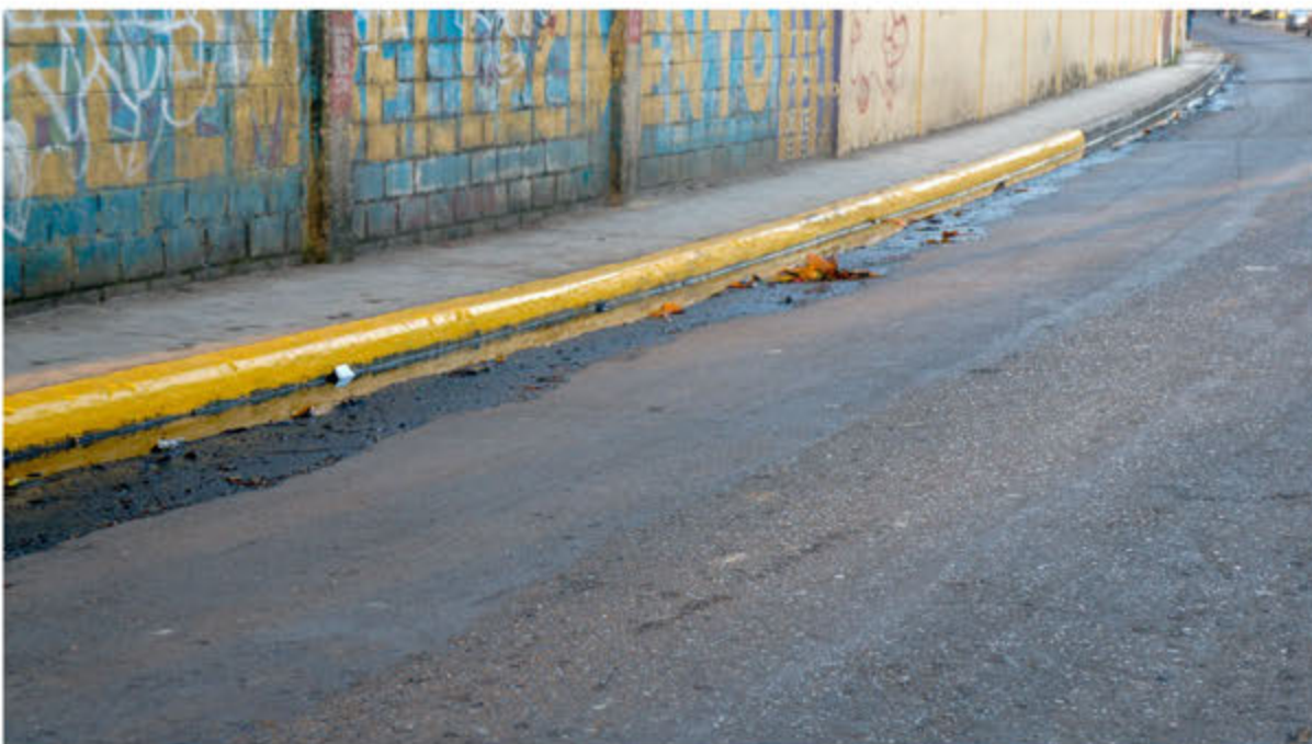
Eliminación de la caja de Mandinga, Villa Faro.

Luego de retirar la basura y escombros de los referidos vertederos, bomberos del ASDE procedieron a lavar los espacios, dejándolos completamente higienizados.