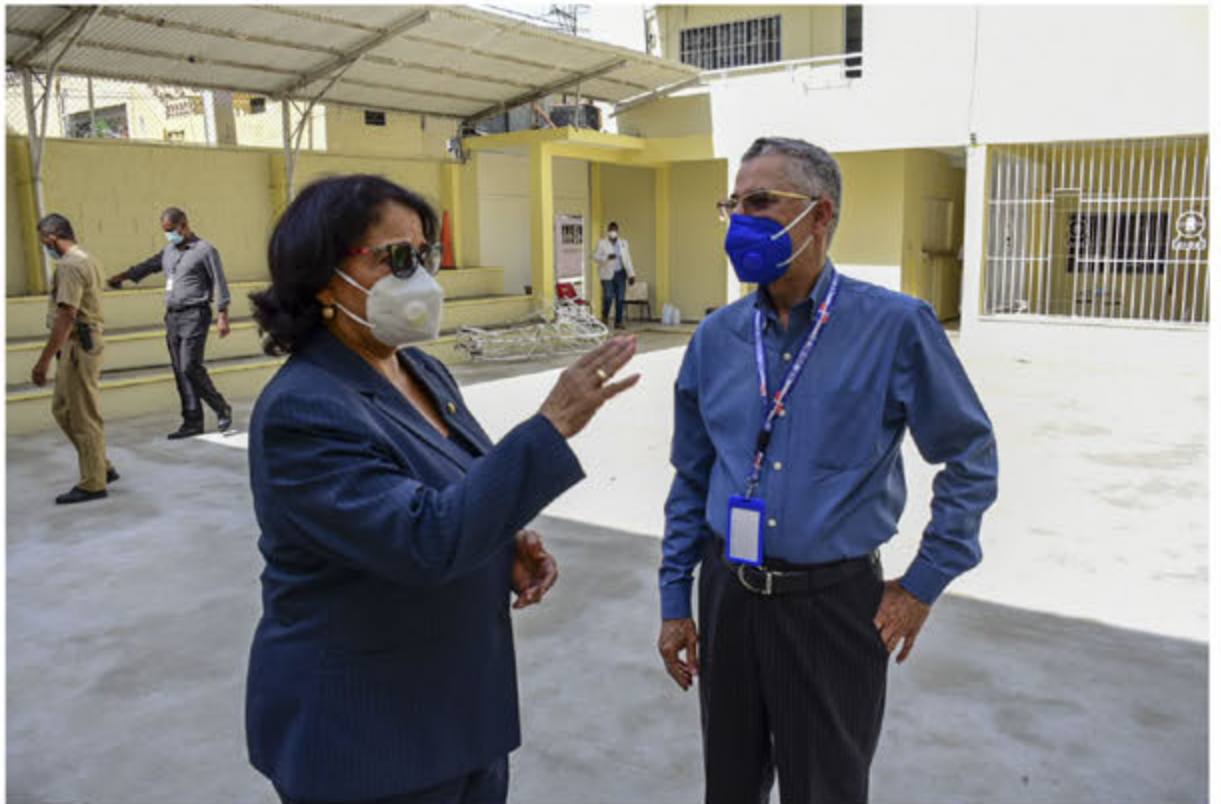
Rectora de la (UASD) Emma Polanco conversando con el Alcalde de SDE Manuel Jiménez.

De su lado la rectora Polanco Melo dijo que el lugar escogido para la instalación del recinto universitario por el alcalde Jiménez, tiene las condiciones necesarias por su tamaño y ubicación geográfica. Ambos estuvieron acompañados de funcionarios de la alcaldía de Santo Domingo Este y vicerrectores de la UASD. La docencia en el nuevo recinto universitario está prevista iniciar a principio de enero del año 2021 de manera virtual dependiendo del comportamiento de la pandemia global de Covid-19.