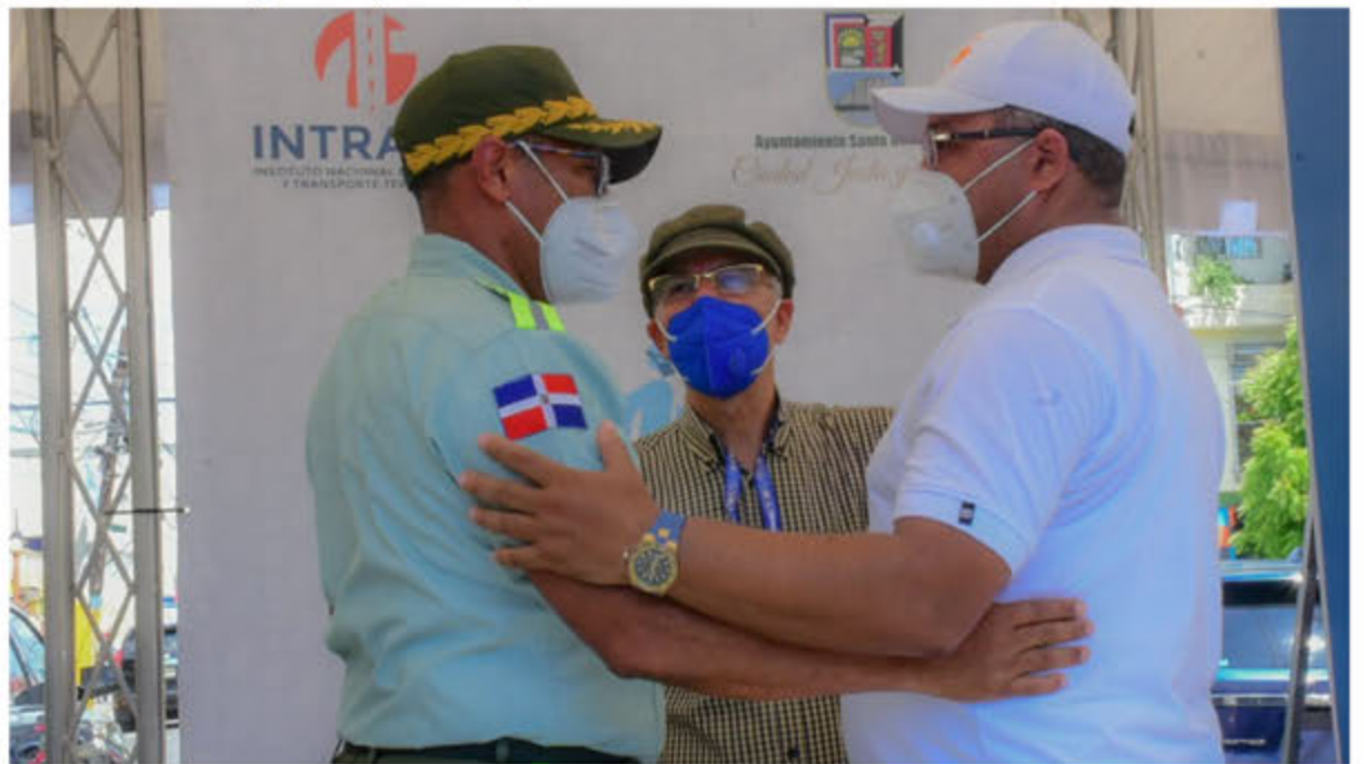
Unificación entre las Instituciones (ASDE), (INTRANT) y (DIGESETT).