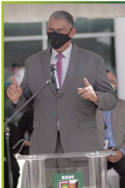
Próximo Ministro de Interior y Policía, Jesús (Chu) Vásquez