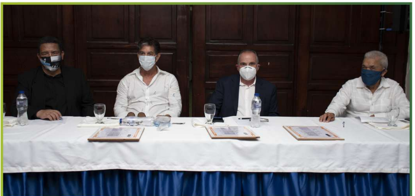
Jurado seleccionador de las 13 canciones finalistas