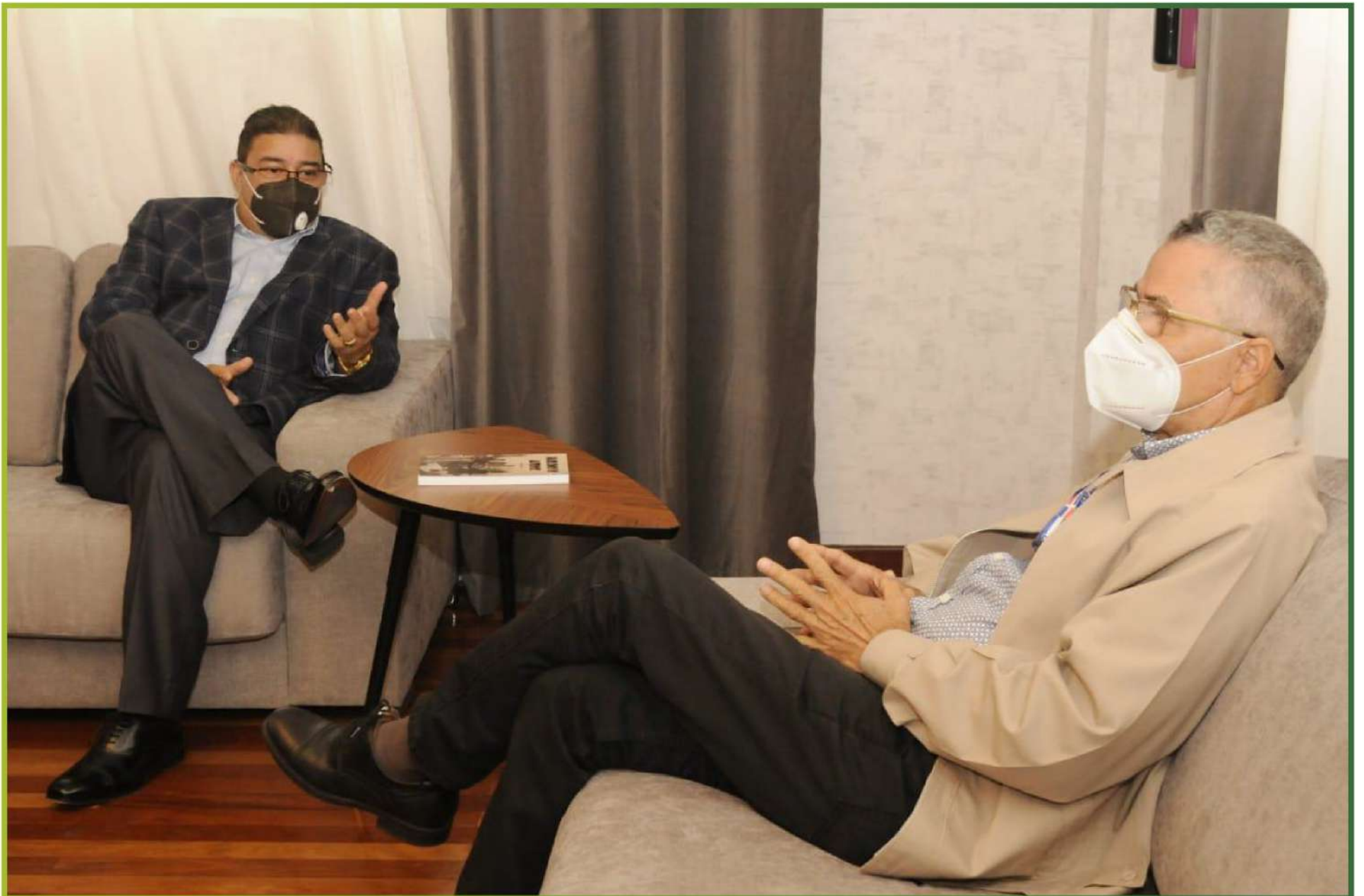
Alcalde Manuel Jiménez y Ministro de Deportes Francisco Camacho

El alcalde de Santo Domingo Este (SDE), Manuel Jiménez sostuvo un encuentro con el ministro de deportes, Francisco Camacho, donde acordaron recuperar la parada de autobuses de Parque del Este y ponerla al servicio de las instalaciones deportivas.