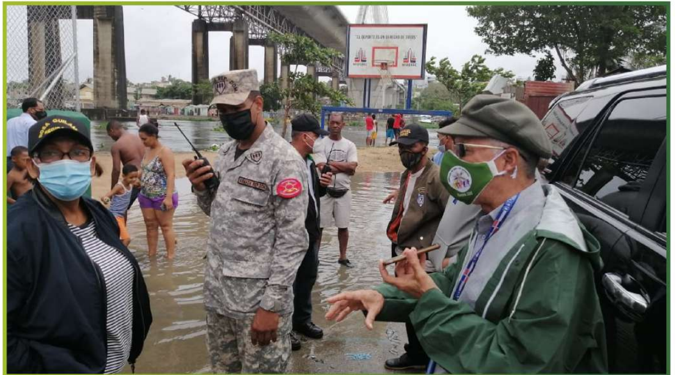
Alcalde Manuel Jiménez, inspecciona varios sectores ante el paso de la tormenta Laura