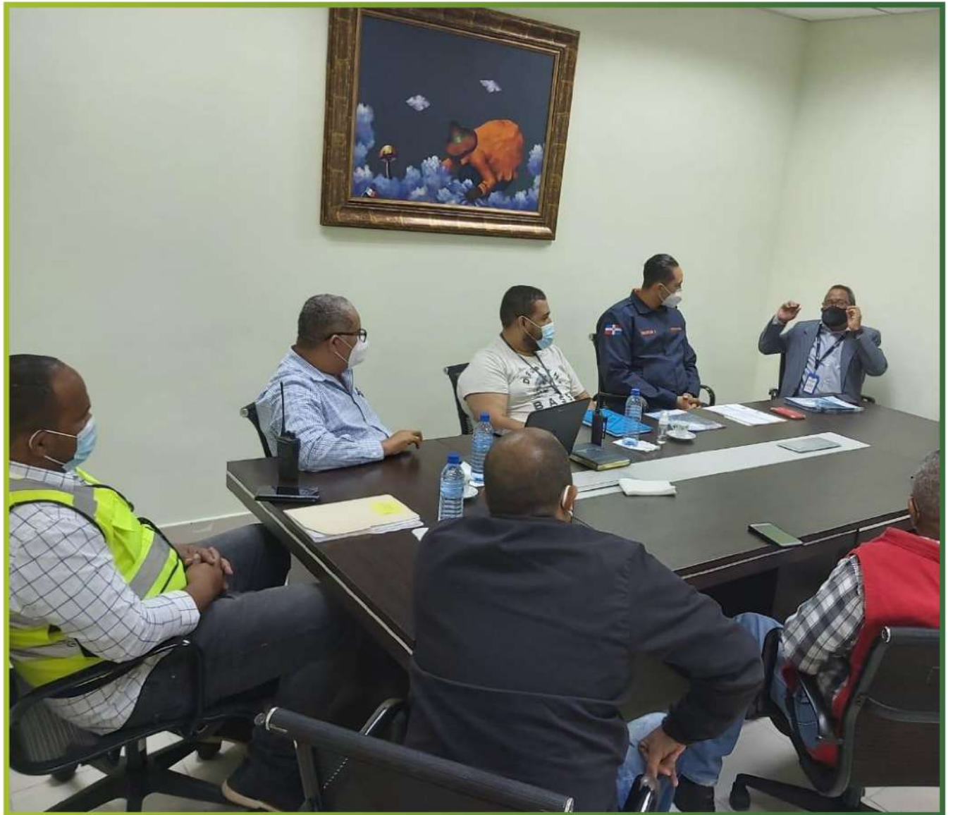
Comité de Prevención de Riesgos ante amenaza

La alcaldía, quien puso en funcionamiento el Comité el pasado 22 de mayo, luego que permaneció varios años cerrado por las autoridades pasada, afirmó que está preparado para salvaguardar las vidas y proteger a los más vulnerables del municipio. El Comité está integrado por una representación del Ministerio de Salud Pública, la Defensa Civil, Cruz Roja, Cuerpo de bomberos, y las Direcciones del Ayuntamiento de Aseo Urbano, Ingeniería y Obras, Ornato, entre otras.