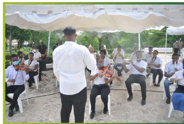
Banda Musical Infanto Juvenil del ASDE